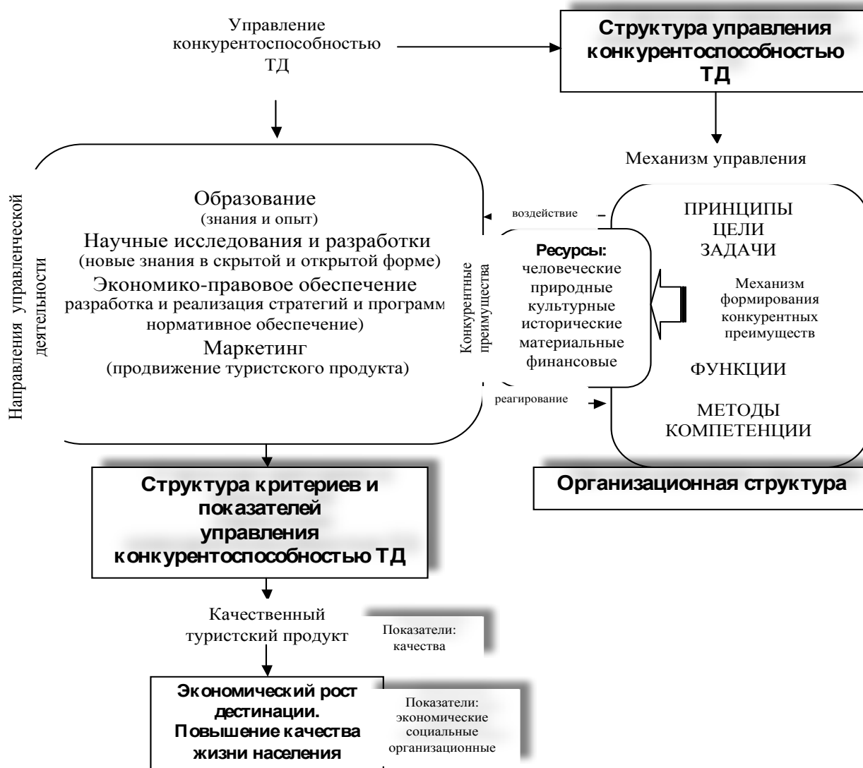
Рисунок 1. — Модель системы управления конкурентоспособностью туристской дестинации (ТД)

В структуре управления, которая описывает замкнутый цикл реализации управляющих воздействий в системе, нами обозначены основные элементы системы управления конкурентоспособностью туристской дестинации: принципы, цели, задачи, механизм, функции, методы, компетенции.