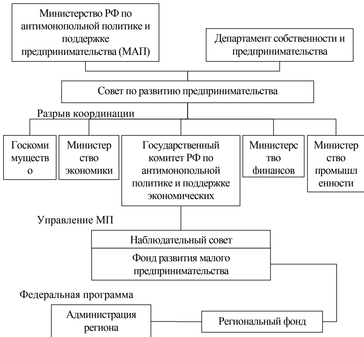
Рисунок 1 - Организационная структура управления малыми предприятиями

Основными задачами МАП РФ являются: - разработка предложений и реализация государственной политики в области развития малого бизнеса; - координация деятельности федеральных ведомств и органов субъектов РФ; - разработка предложений по упрощению системы государственной регистрации малых предприятий, используемых ими систем бухгалтерской, налоговой и статистической отчетности и др.