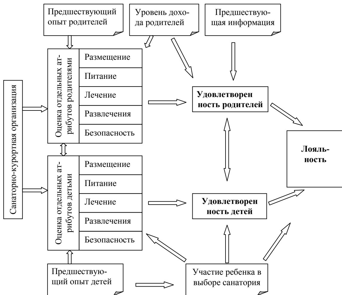
Рисунок 3 – Структурная модель потребительской оценки качества детских оздоровительных услуг

Одним из наиболее серьезных вопросов в организации детского отдыха является качество предоставляемых услуг. При этом потребительская оценка качества сервиса у детей представляет значительные трудности в виду специфики детского отдыха. На основании проведенных исследований автором была разработана концептуальная структурная модель потребительской оценки качества детских оздоровительных услуг (рисунок 3).