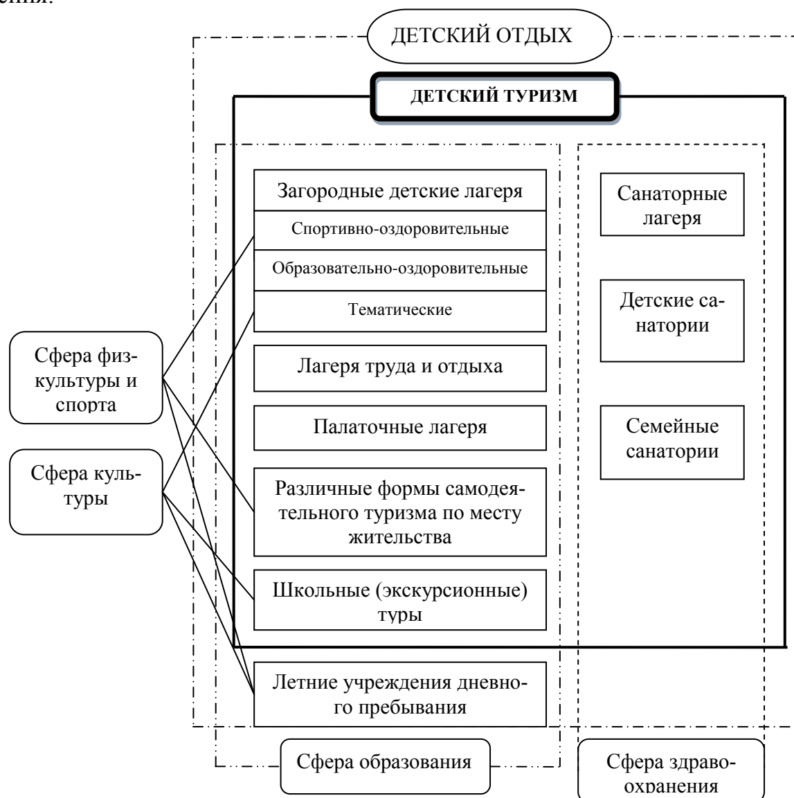
Рисунок 1 – Место детского туризма в социальном пространстве

На представленной ниже схеме (рисунок 1) автором предпринята попытка уточнения места детского туризма в системе детского отдыха, оздоровления и лечения.