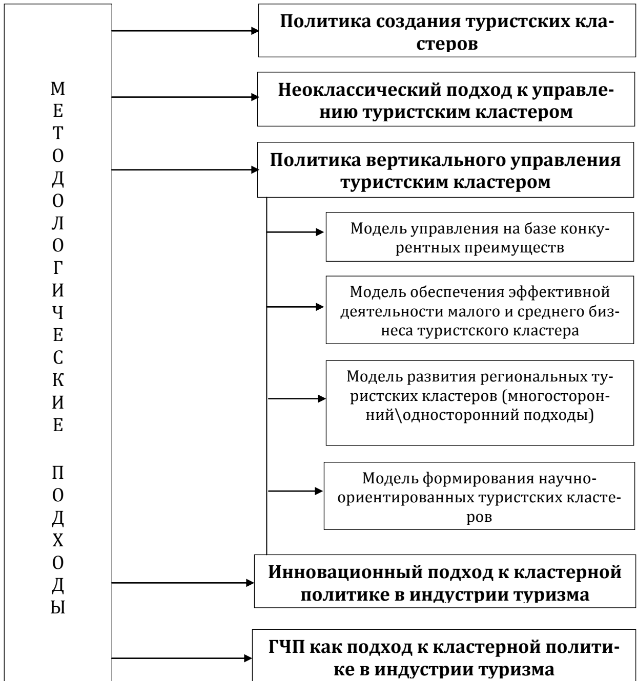
Рисунок 1 – Методологические подходы к определению государственной политики в области туристских кластеров

На основе изученной информационно-аналитической базы, автор предлагает выделять следующие универсальные методологические подходы к определению и обоснованию кластерной политики в сфере туризма, исходя из приоритетных направлений воздействия на туристское пространство и его окружающую среду (рис. 1).