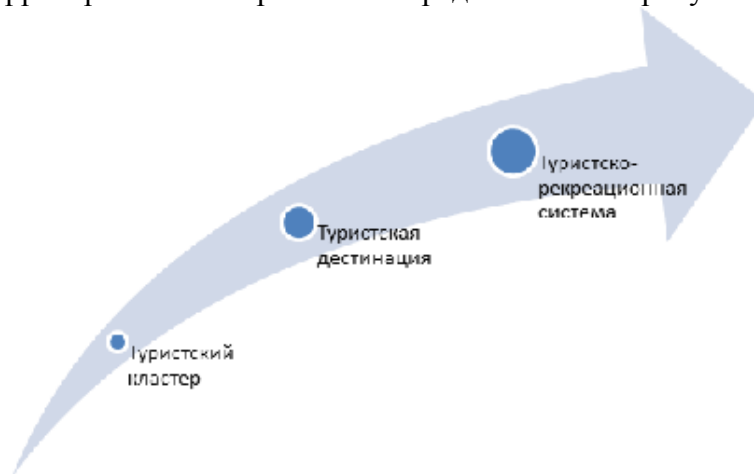
Рисунок 1 –Уровни территориальных образований (составлено автором)

позволяет объединить несколько туристских дестинаций, повышая привлекательность туристского региона и увеличивая туристские потоки. Уровни территориальных образований представлены на рисунке 1.